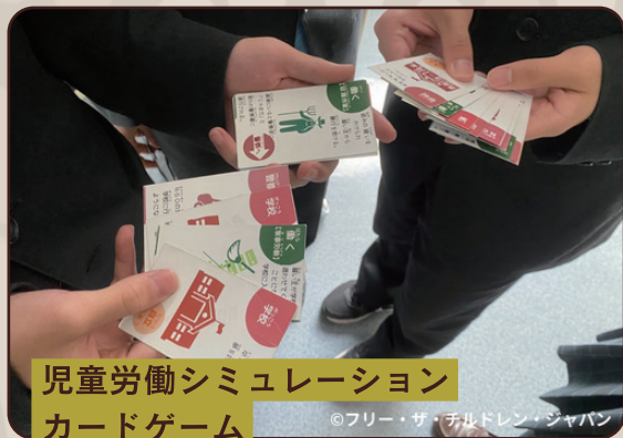
児童労働シミュレーション カードゲーム

そもそも フェアトレードって何？ フェアトレードの商品を食べてみたい！ という方も大歓迎！