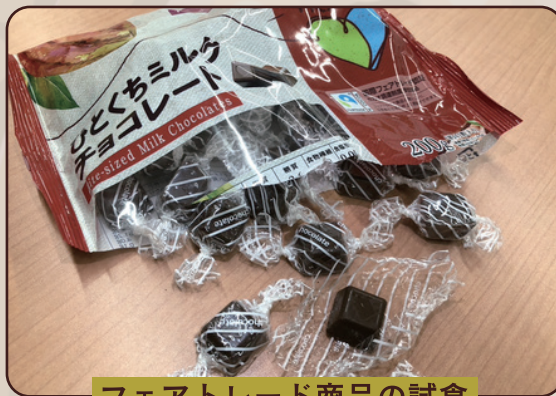
フェアトレード商品の試食