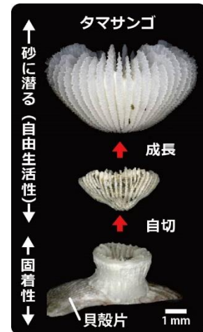
図 1：生活様式や形態が大きく異なるタマサンゴ

その結果、貝殻片などに固着した小さな円柱状の個体から、横分裂と呼ばれる骨格を上下に分割する分裂方法 (自切) を用いて、砂に潜れるタマサンゴを無性的に形成していることがわかりました。さらに、こども時代の個体では、将来切り離す部分の骨格だけが砂に潜れるタマサンゴの形態に成長しており、横分裂により切り離された個体がすぐに砂に潜れるように、貝殻片に固着していた時から将来を見越した周到な準備がなされていました。砂に潜ることは、捕食者から身を守ることにつながり、切り離した個体の生存の可能性が飛躍的